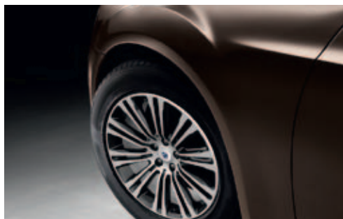
PTW - Luxury Brown