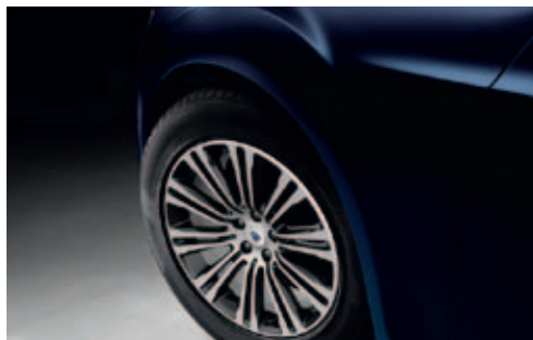
PBV - Blackberry