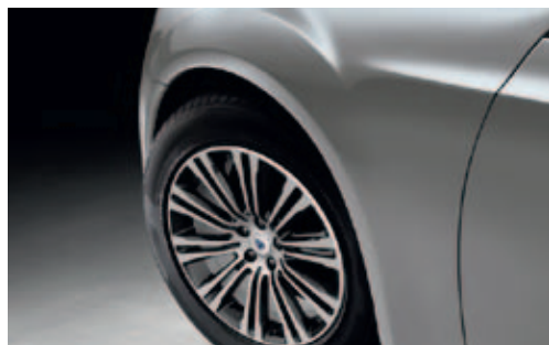
PFS - Cashmere